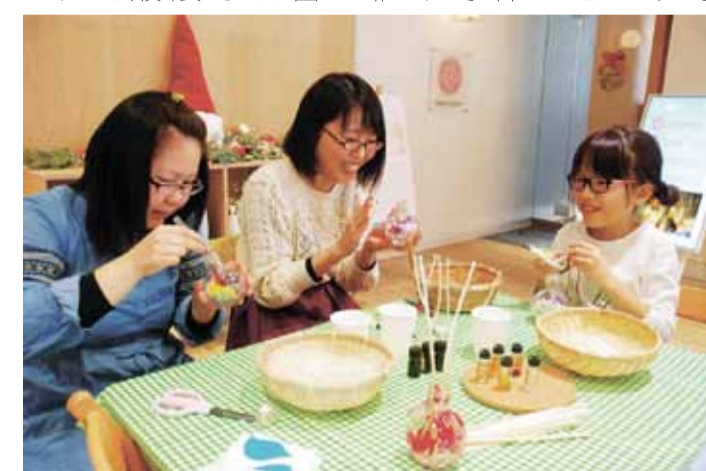
▲好きな花でルームフレグランスを作る参加者

その後、ボトルの中にローズやラベンダーなど好きな香りのエッセンシャルオイルを垂らし完成させた。参加者たちは「初めて作ったけどステキにできた」、「いい香りなのでリビングに飾りたい」と瞳を輝かせていた。