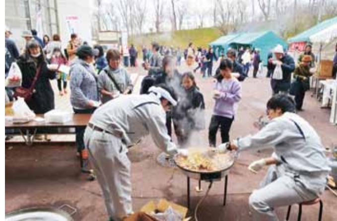
▲炊き出しでにぎわう会場(早来町民センター)

生活応援企画として「第1回生活応援バザー」を開催。震災後、同町には食料品や生活用品などの支援物資が全国各地から寄せられた。バザーは避難中や停電中の時などに町民に配布してきた支援物資の残りの中から、賞味期限や保管場所の確保などで継続して保存できない物を無償で提供しようと企画。早来町民センター(早来北進102)と追分公民館(追分緑が丘200)の2会場