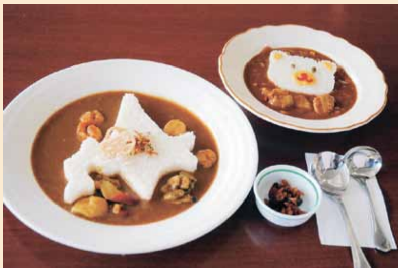
▶ほっきシーフードカレーとこくまカレー

道の駅ウトナイ湖内に2013年3月にオープンした、ノーザンホースパーク(美沢114)が運営するセルフサービスの食堂。15年10月にメニューを一新し、標津郡中標津町の上原農場で無農薬栽培されたそば「遥の里」の粉から自家製麺した二八そばのメニューを展開している。11月20日からは新そばが登場。2種類のだしとかえして作ったオリジナルのつゆとの相性も良く、「もりそば」(650円)や「ほっきと野菜のかき揚げそば」(900円)などが人気だ。