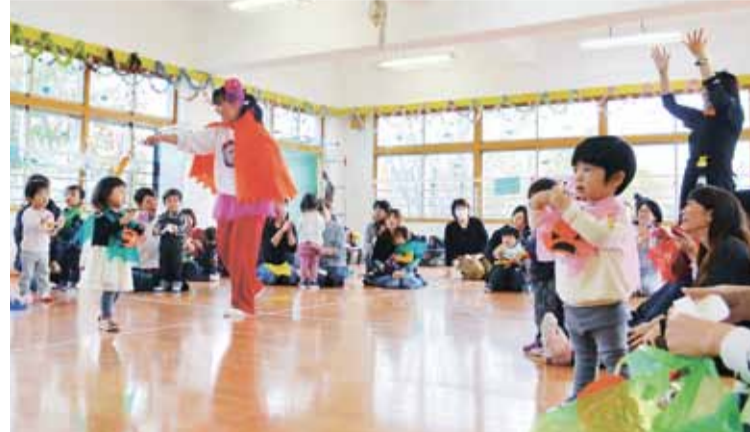
▲歌や踊りのレクリエーションを楽しむ親子

小牧市しらかば町5のエンゼルス幼稚園で10月24日、地域開放事業の親子レクリエーション「ハロウィンパーティー」が行われ、入園前や同園のプレスクールに通う子どもたちが大勢詰めかけた。親子はカラービニールにカボチャやリボンのシールを貼り付けた衣装と、ペットボトルのキ