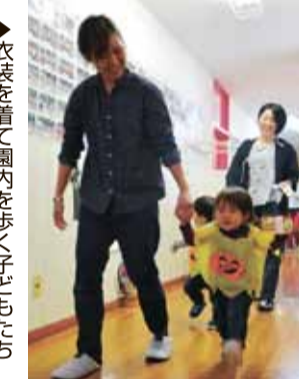
▶衣装を着て園内を歩く子どもたち

小牧市しらかば町5のエンゼルス幼稚園で10月24日、地域開放事業の親子レクリエーション「ハロウィンパーティー」が行われ、入園前や同園のプレスクールに通う子どもたちが大勢詰めかけた。親子はカラービニールにカボチャやリボンのシールを貼り付けた衣装と、ペットボトルのキ