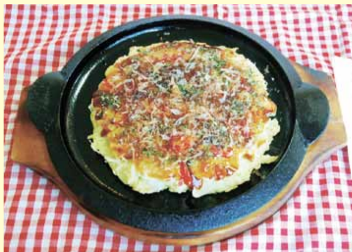
▶アツアツが楽しめる「お好み焼き」

1992年にオープンし、今月26周年を迎えた住宅街に店を構える喫茶店。開店以来ほとんど値上げしていないというリーズナブルな価格で懐かしの喫茶店メニューを味わえると、古くからのファンが多く通っている。