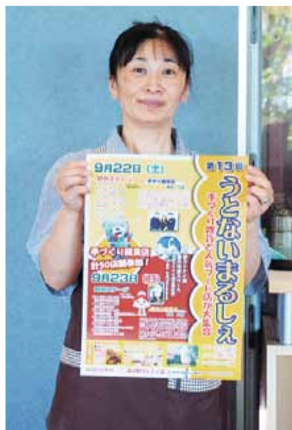
▲「ぜひ遊びに来てほしい」とPR

「Sweets & donut s Do.」(同、綿あめの「レインボーコットンキャンディ」(千歳)のほか、苦小牧の「ノーザンホースパーク」(22日)と千歳の「ブルーランジュリー・エール」(23日)が焼きたてパンを販売する。野外ステージには、地元で