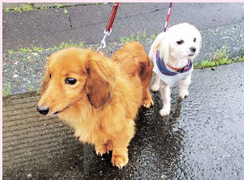
ミニチュアダックスフントのトマトくん(12歳) マルチワのノンちゃん(2歳)