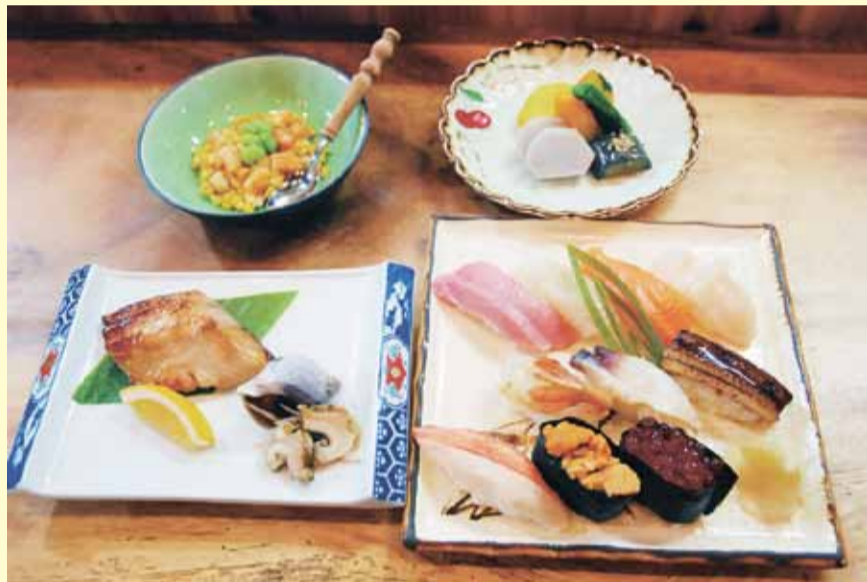
▲握り寿司の「海洋」と「ホッケの西京漬焼き」(800円)、 「甘えびとトウモロコシのバター炒め」(500円)、 「野菜の炊き合わせ」(400円)=右手前から時計回り=

苫小牧市大町の飲食店街に今年4月にオープンした寿司店。カウンター7席と4人がけの小上がり2卓という隠れ家的なこの店には、口コミで評判を聞きつけたお客さんが多く訪れている。