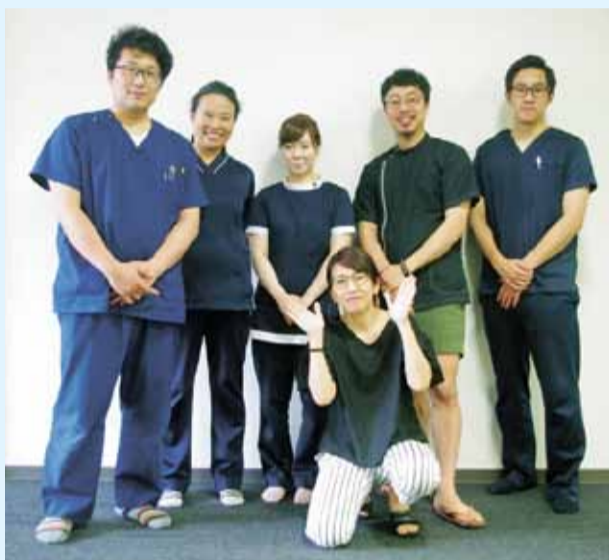
▲元気で笑顔いっぱいスタッフ