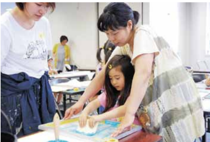
▲慎重に絵の具を刷る子どもたち

シルクスクリンは、枠に張った目の細かい布を介して印刷する版画技法の一つ。子どもたちは、新聞紙を動物やゲームのキャラクターなど好きな図案に切り抜いて型を作った。