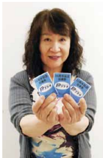
▶抽選券を集めてぜひ賞品をゲットしてGETTING

同プラザは1970年に開業。当時は入居する王子不動産第2ビルの地下から3階までテナントが30軒ほどあったという。50周年を迎え、同プラザは1970年に開業。当時は入居する王子不動産第2ビルの地下から3階までテナントが30軒ほどあったという。