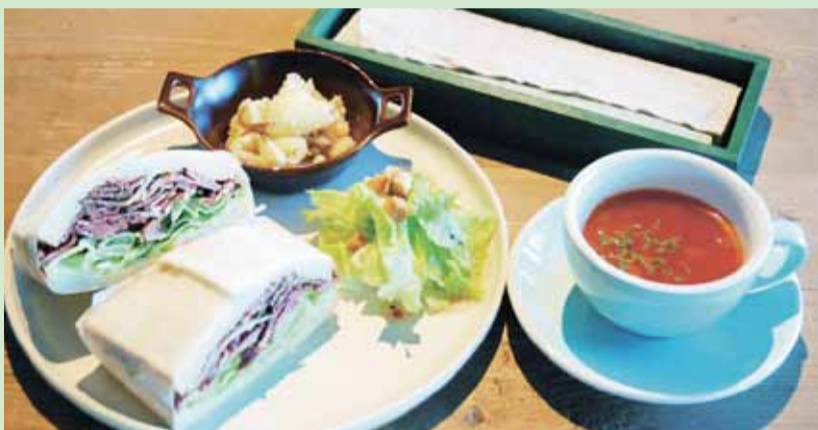
▲スパイシーな大人の味の「パストラミビーフサンドセット」 (セットのドリンクは「本日のスープ」)

昨年11月オープンした住宅メーカー「ウエストホームズ」のショールーム内に併設されたカフェ。明るい日差しが入るガラス張りの店内は洗練されたインテリアで彩られ、おしゃれで落ち着いた雰囲気を引き立てている。スタッフは「お茶や食事をゆっくり楽しんでもらえたら」と話している。