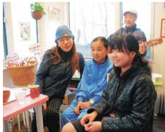
▲ボランティアスタッフらと交流を楽しむ子どもたち