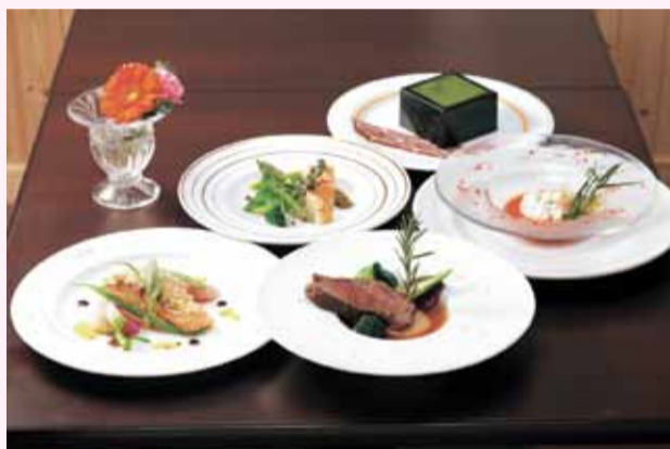
▲3月に登場した「フルコース」

白老町の国道36号線沿いに昨年12月にオープンしたフレンチレストラン。「白老牛いわさき」などを展開している合同会社いわさきファームが運営している。胆振管内の食材をふんだんに使った本格派フレンチが味わえると評判を呼び、町内外から多くの人々が訪れている。