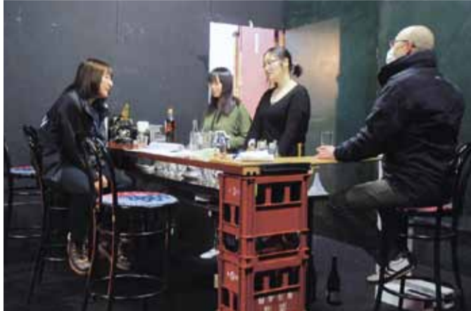
▲練習に熱を込めるメンバー

3月3日の1日限り、700円以上の食事をし「よみうりプラザを見ました。20周年おめでとう」と注文時に言ったお客さんに300円割引サービスを実施する。この機会、お見逃しなく!