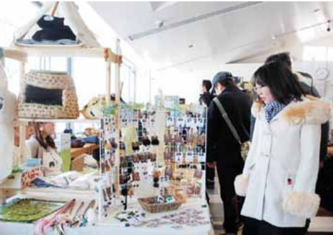
▲1月に行われ多くの猫好きが訪れた「にゃんこいち」

猫グッズや猫モチーフにした雑貨や焼き菓子などを集めた「にゃんこいちvol.1」が2月24、25日の両日、苦小牧市植苗の道の駅ウトナイ湖で開かれる。手づくりの猫モチーフの雑貨やペットグッズなどを販売する苦小牧の「Chattoco」(ちやっこ)が主催し、昨年11月に初開催した。3回目となる今回は、24日がポディアートの「mikan juice」(ミカンジュース)、「アニマルコミュニケーション」の「hear」(ヒール)、「カフェズキッチン Google Berry」(グ